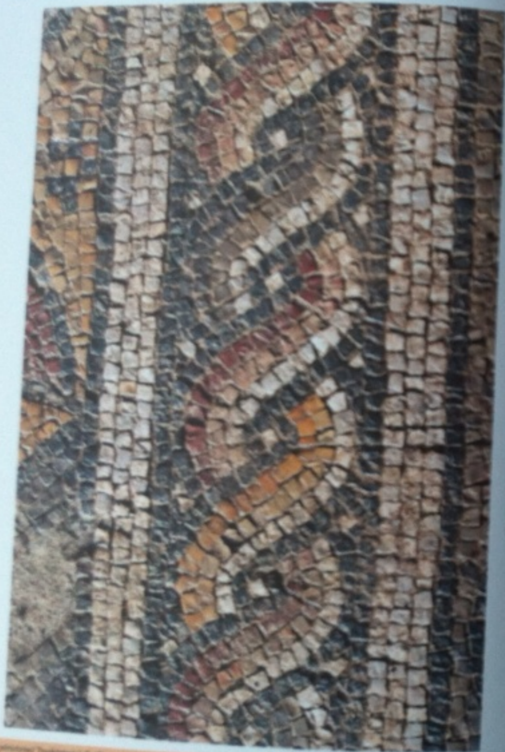
Mosaiku e Drenovës - Kllin / Mosaik in Drenovë - Kllin / Mosaic in Drenovë - Kllin